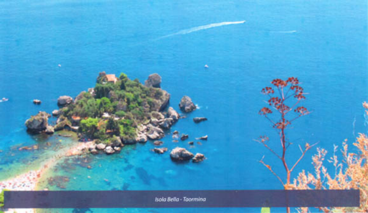
Isola Bella - Taormina